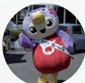
鳩山町イメージキャラクター「はーとん」も来るよ!