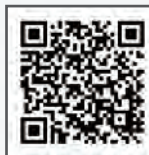
無料送迎バス運行時間